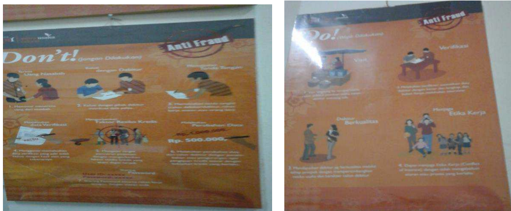
Gambar 5 dan 6 Slogan Bank BTPN UMK MUR Cab 10 Ulu Palembang 10