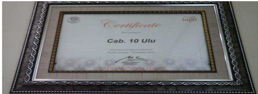
Gambar 9 Sertifikat salah satu cabang Bank BTPN UMK MUR 19