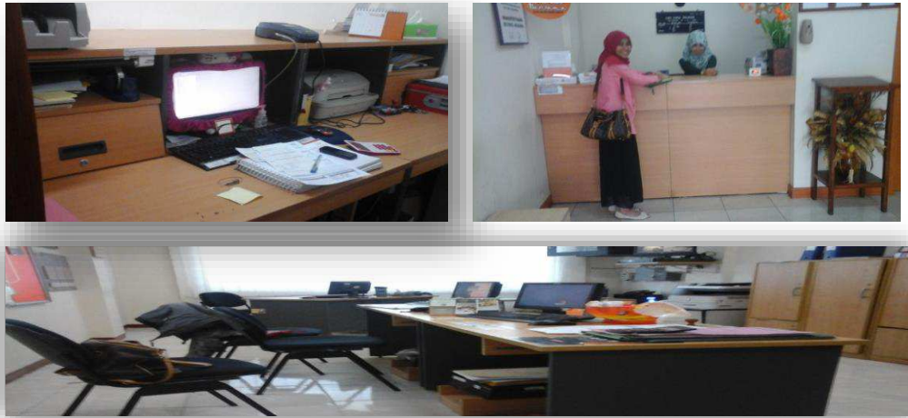
Gambar 10,11 dan12 Sarana dan Prasarana di Bank BTPN UMK MUR 29