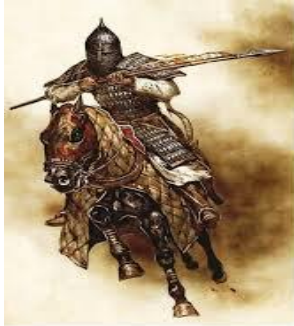
Ganbat Badarakhand. Тяжеловооруженный осадник-мамлюк, вторая половина XIII века.